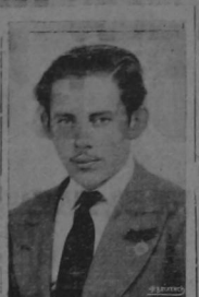
C. Rendón del Sector N°7. Coifdecorado en el Mitin del 19 de Marzo

Así interesaditos con hechos concretos, también he logrado yo ganar varios militantes nuevos, entre los que parecían más reacios, y más enemigos del Partido— Total, que estoy orgulloso de haber ganado, está medida con las siete estrellas, por haber podido reclutar treinta nuevos camaradas para el Partido.—