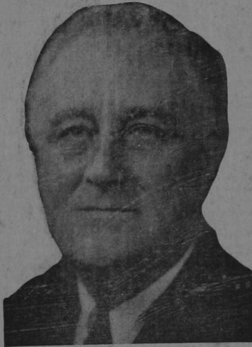
FRANKLIN D. ROOSEVELT

El tribunal respectivo condenó al compañero Guevara considerando injuriosos, pero no columniosos, los conceptos del artículo acusado. Es decir, el tribunal reconoció que los cargos eran ciertos. El compa Pero Guevara irá, pues, seis días a la cárcel. El debe sentirse orgulloso por eso. Tam, bien, su partido. Es mejor de honrar para nosotros que se meta a la cárcel a los miembros del partido por servir los intereses del pueblo.