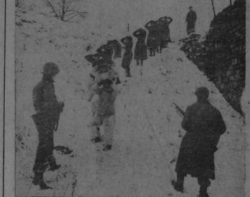
Con las manos sobre la cabeza soldados del ejército nazi, vigilados por soldados de los Estados Unidos, son conducidos a retaguardia en el frente occidental.

tejando, de "bandidos" a "el general Chu Teh, comandante en jefe del Octavo Ejército Comunista. Los japoneses. Estos tienen en verdad por qué odiar a los ardentemente y patriotas luchadores, sino, soldado de 60 años como a un padre. Su rostro refleja optimismo y cordialidad, irrealizable, y su vigoroso, apretón de manos inspira confianza. Otro "Bandido" que produjo impresión en todos los extranjeros que visitaron Yenan el último verano, es